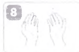
ваши руки в безопасности согнув пальцы, протрите правой рукой левую ладонь, и наоборот