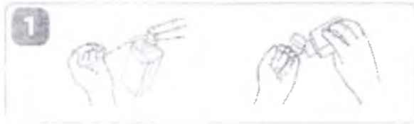
нанесите средство для обработки