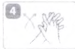
протрите между пальцами