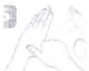
отдельно протрите большие пальцы рук