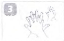
затем правой ладонью разотрите руки в «замок» тыльную сторону левой кисти, согнув пальцы, растирайте переплетая пальцы, и наоборот руки